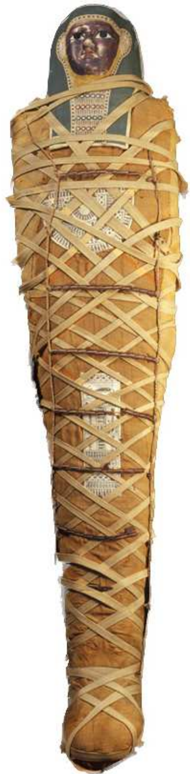
Momie de Nedjem Ati. Antinoé, Époque ptolémaïque. Textiles et matières organiques. Lyon, Musée des Confluences.

En couverture : Statut d'Isis allaitant Horus dédiée à Chapenoupet, divine adoratrice d'Amon, Medinet Habou, XXV e dynastie