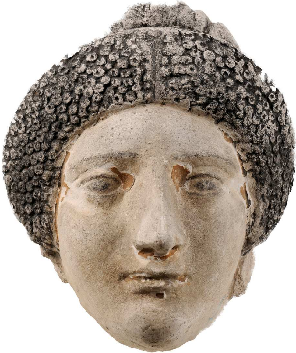
Masque funéraire, Antinoé, époque romaine. Musée des Beaux-Arts de Lyon