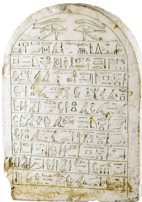
Stèle dédiée à Osiris par la famille du préposé aux magasins de pharaon, Sésostris-Ankh Abydos, 3 e période intermédiaire. Calcaire Acquis par Émile Guimet avant 1874 Lyon, Musée des Beaux-Arts

Paris, Musée du Louvre, département des Antiquités égyptiennes, Paris, Musée du Louvre, département des Antiquités grecques, étrusques et romaines, Paris, Bibliothèque centrale des musées nationaux, Paris, Musée Guimet – musée national des Arts asiatiques, Paris, Musée d'Orsay, Paris, Bibliothèque nationale de France, Paris, Bibliothèque de l'Institut de France, Lille, Palais des Beaux-Arts, Rouen, Musée des Antiquités de Seine Maritime, Collection particulière de la famille Guimet, Lyon, Musée des Confluences, Lyon, Musée des Tissus, Lyon, Musée Gallo-romain, Lyon, Institut Lumière, Lyon, Bibliothèque municipale, Lyon, Archives municipales, Grenoble, Bibliothèque municipale d'étude et d'information.