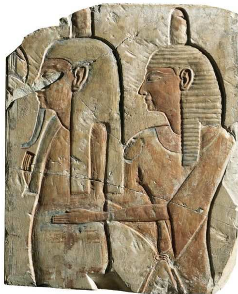
Bas-relief funéraire : Prêtre soutenant la momie du défunt. Deir el-Bahari, Époque ramesside (XX e dynastie), Calcaire peint, Lyon, Musée des Beaux-Arts.

Gournah, Période romaine, I er -II e siècle ; Ossements, tissu. Collection du muséum d'Histoire naturelle de Lyon. Lyon, musée des Confluences