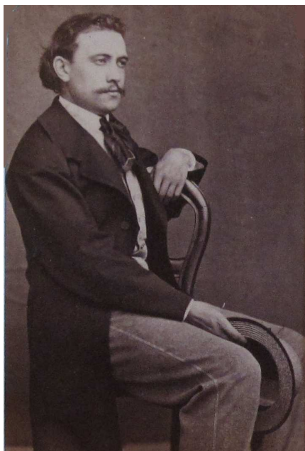
Émile Guimet Épreuve photographique Collection particulière