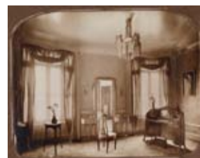
Hôtel Guimard, vue partielle de la chambre à coucher de madame Guimard, Épreuve d'époque New York, The Cooper-Hewitt Museum, don d'Adeline Oppenheim-Guimard, 1956