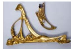
Hector Guimard, Console, 1909-1912, bronze doré, Lyon, musée des Beaux-Arts

Hector Guimard citant Victor Horta, Revue des Arts Décoratifs , 1899.