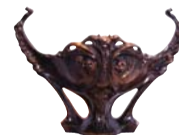
Hector Guimard, Coupe de jardin, vers 1905, Fonte (Fonderies de Saint-Dizier, Haute-Marne)

Les anses courbes de cette coupe de jardin et les motifs végétaux qui ornent sa surface sont typiques du vocabulaire de l'Art Nouveau. La fonte de fer témoigne de l'intérêt des artistes pour les nouveaux matériaux, moins onéreux et donc susceptibles de favoriser une plus grande diffusion de leurs créations. Hector Guimard s'associe ainsi avec les fonderies de Saint-Dizier pour concevoir un ensemble d'objets commercialisés par le biais d'un catalogue publié en 1907.