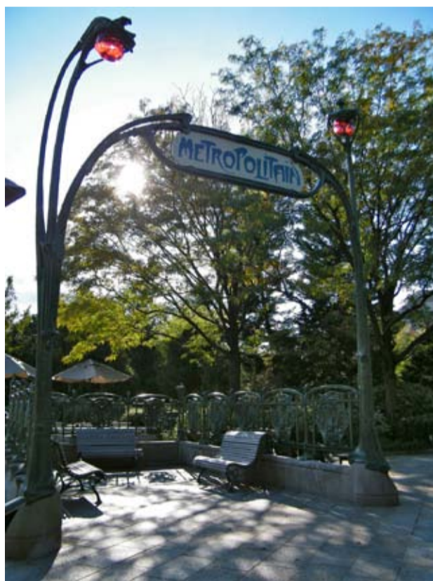
Hector Guimard, Entrée du Métropolitain , 1900, Paris

Ceux-ci sont installés tout au long de la ligne 1, inaugurée en juillet 1900. Modifiant profondément le paysage urbain parisien, ils suscitent rapidement la critique. En 1904, la Compagnie du Métro choisit ainsi de refuser les plans de Guimard pour la station Opéra. Jusqu'en 1914 toutefois, des entrées de stations conçues par Guimard continuent d'être installées le long des dix lignes du métro parisien.