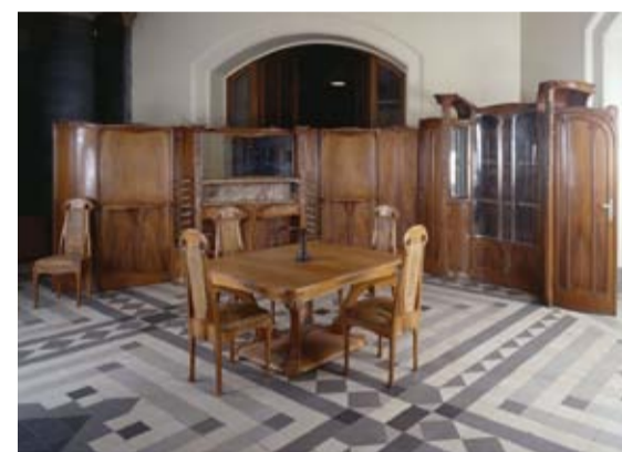
Hector Guimard, La salle à manger de l'hôtel Guimard , vers 1900, mobilier en bois, Paris, Musée du Petit Palais

En 1930, les époux Guimard quittent l'avenue Mozart pour la rue Henri-Heine. Guimard a alors l'idée d'offrir à l'État l'hôtel et son contenu pour en faire un musée de l'Art Nouveau. Après la mort de son mari à New York en 1942, Madame Guimard reprend le projet mais devant le refus des autorités, elle se résigne à disperser le mobilier de l'hôtel en le proposant à plusieurs musées. La chambre est ainsi donnée au musée des Beaux-Arts de Lyon en 1948, une horloge de parquet rejoint les collections du musée des Arts décoratifs à Paris, la Ville de Nancy accepte quelques pièces qui seront présentées plus tard dans le musée de l'École de Nancy. La salle à manger, boiseries et mobilier, est présentée à Paris au Musée du Petit Palais. Le reste est donné à divers musées américains.