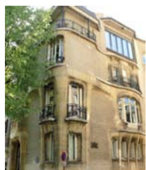
Hector Guimard, façade de l'hôtel Guimard, 1909-1912, Paris

L'architecte dessine le bâtiment, son ameublement et jusqu'aux moindres détails de la décoration : luminaires, rideaux, moquettes, bibelots, linge de table. Il signe ainsi en 1912 une œuvre d'art totale déjà éloignée de l'exubérance des années 1900.