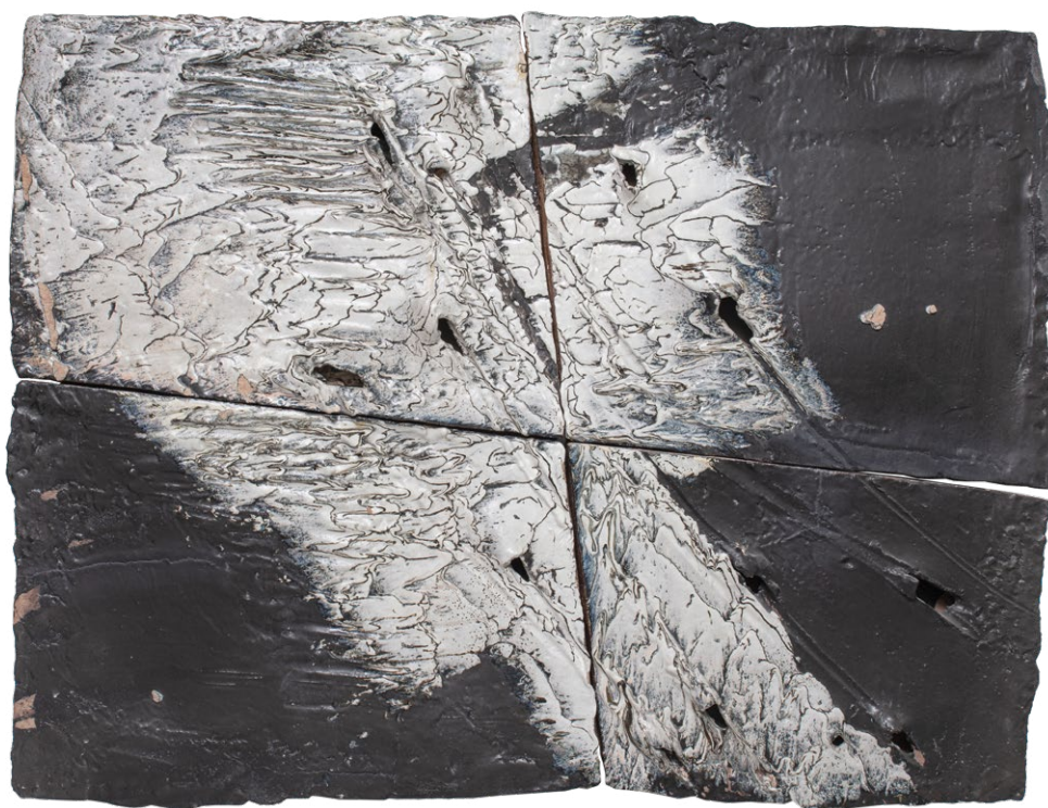
Claude Champy, Composition murale , 1996

Les artistes libèrent la céramique des impératifs fonctionnels et en explorent les qualités plastiques. Ils abordent ainsi le matériau comme un moyen de créer en « volume » et poursuivent les recherches formelles des pionniers de cet art, fondées sur les notions d'équilibre et de composition, de rapport à l'espace et à la lumière. Les céramiques, de plus en plus abstraites, s'intègrent parfois, sous la forme d'installations, dans la ville ou le paysage. La conquête de la couleur s'est faite progressivement, parallèlement aux recherches sur la matière, les textures et les effets de surface.