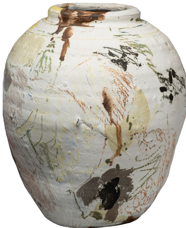
Claude Varlan, Petit vase, 1999

Avec l'émail, le souvenir de la terre tend à s'effacer. Dans la céramique contemporaine, la couleur souligne la forme et accentue les volumes. Influencés par l'expressionnisme abstrait américain, et en particulier l'Action painting dont la figure majeure est le peintre Jackson Pollock (1912-1956), les céramistes s'expriment par le geste, la couleur et la matière. La surface céramique s'apparente à une toile, qu'il est alors possible de « marquer » afin d'en révéler la profondeur et l'espace, suivant la voie ouverte par le peintre et sculpteur Lucio Fontana (1899-1968) qui, le premier, a incisé ou transpercé ses tableaux.