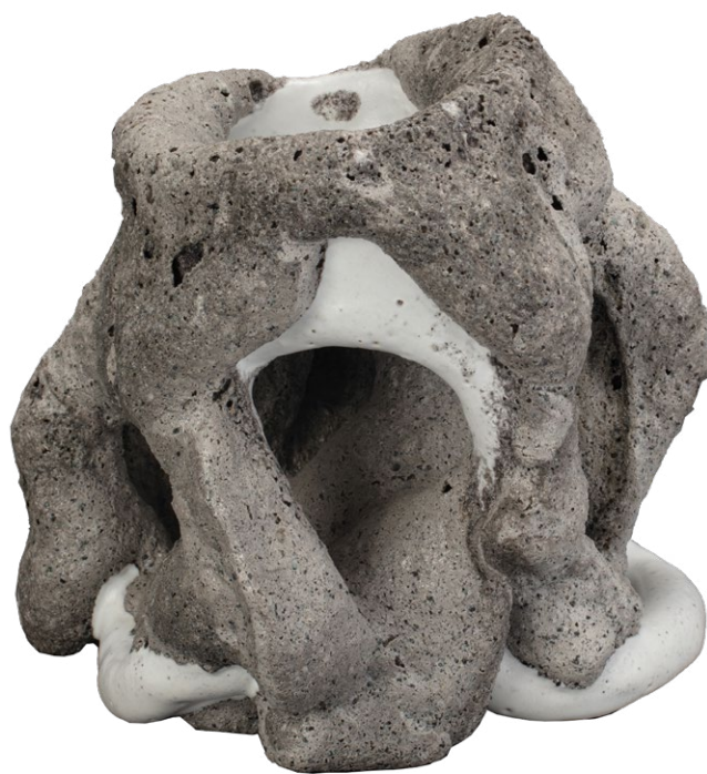
Bente Skjottgaard , Grey white species n° 1557, 2015