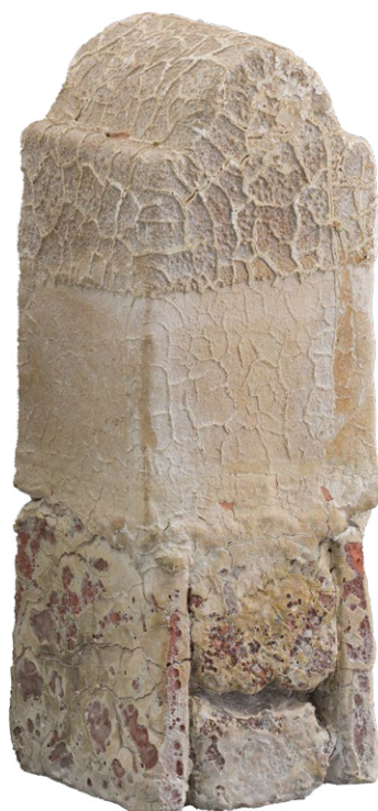
Camille Virot , Petites maisons en forme de stèles funéraires

Collection Denise et Michel Meynet. © Camille Virot.