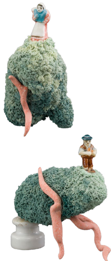
Beatriz Trepas , Paire de sculptures biomorphiques, 2017