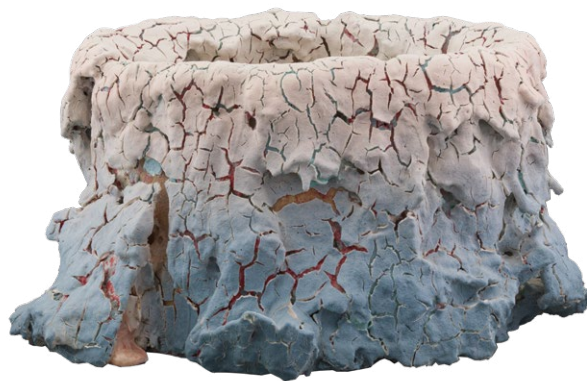
Irina Razumovskaya, Blue mist vessel; série Barkskin'18, 2019