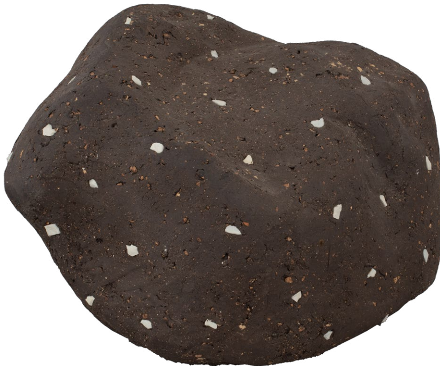
Daniel Pontoreau, Pierre étoilée , 2014

Ces dernières années, les artistes se sont tournés vers les fours à gaz ou électriques pour des cuissons maîtrisées. Certains ont modifié leur approche en introduisant également de nouveaux types de matériaux afin d'exploiter les qualités expressives des « techniques mixtes ».