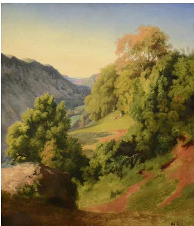
Paul Flandrin Vallée près de Lacoux, dans le Bugey, 1841, huile sur toile

À partir du milieu des années 1850, Paul passe une partie de ses étés dans le Nord de la France, captivé par la « mer admirable et le sublime spectacle » des côtes normandes, comme il l'écrit dans ses carnets. Il réalise alors une séquence de marines dans les environs du Tréport et d'Arromanches, où sa tendance marquée à la simplification donne des résultats d'une pureté inattendue.