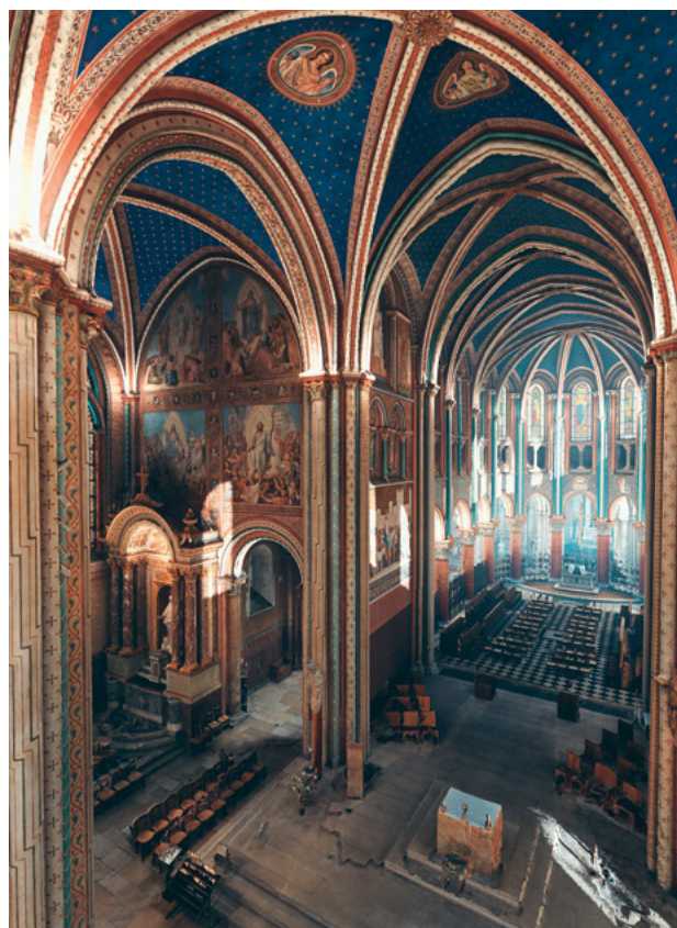
Numérisation des décors de l'église Saint Germain-des-Prés.

Ce projet a été conduit en partenariat avec la Conservation des œuvres d'art religieuses et civiles de la Direction des affaires culturelles de la Ville de Paris.