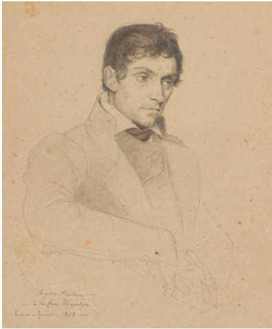
Auguste Flandrin, Autoportrait, 1833, crayon graphite et estompe sur papier Collection particulière.