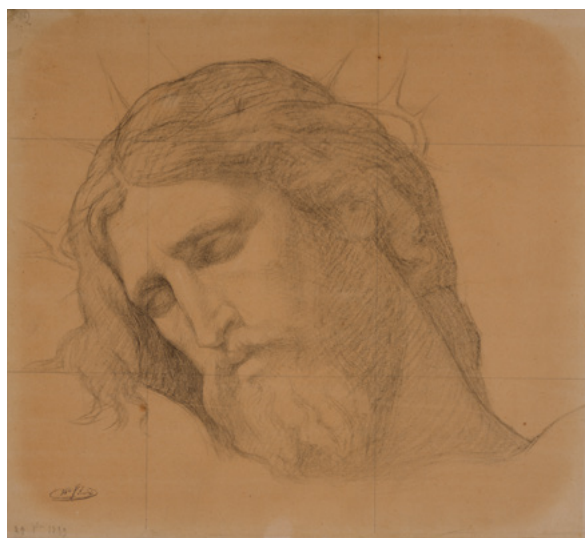
Hippolyte Flandrin Étude pour le visage du Christ, pour La Mort de Jésus-Christ sur le Calvaire , pour le décor de la nef de l'église Saint-Germain-des-Prés, Paris, 1859. Pierre noire sur calque avec mise au carreau Lyon, musée des Beaux-Arts