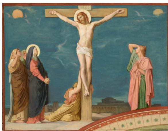
Hippolyte Flandrin La Mort de Jésus-Christ sur le Calvaire , esquisse pour le décor de la nef de l'église Saint-Germain-des-Prés, Paris, 1860, huile et tracé au crayon graphite sur papier marouflé sur carton Lyon, musée des Beaux-Arts.