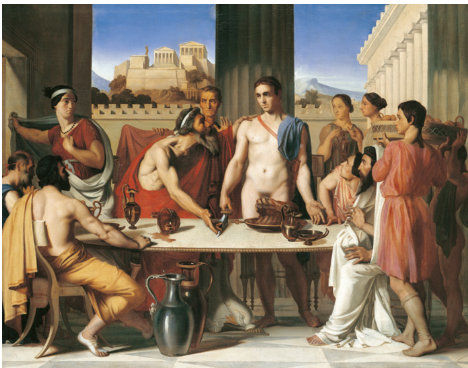
Hippolyte Flandrin, Thésée reconnu par son père , 1832, huile sur toile

Le dessin est la base de l'enseignement prodigué à l'atelier d'Ingres, s'appuyant sur l'étude d'après l'antique et les maîtres anciens, puis, dans un second temps, d'après le modèle vivant. Les frères Flandrin s'inscrivent en parallèle à l'École des beaux-arts qui, à Paris, n'est pas tant un lieu d'apprentissage que de concours d'émulation. Le plus important est le prix de Rome, décerné chaque année à l'issue d'un processus très sélectif. Hippolyte le remporte en 1832, s'ouvrant ainsi les portes d'un séjour de cinq années à Rome, à la villa Médicis, financé par une pension accordée par l'État.