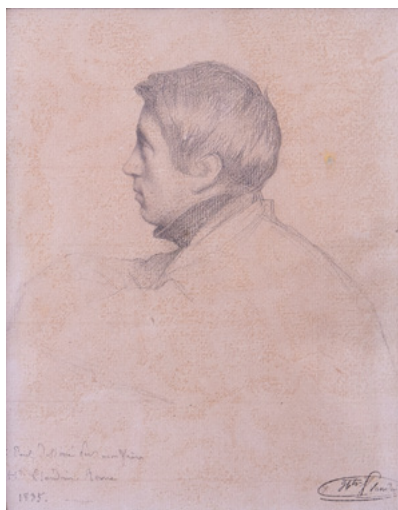
Hippolyte Flandrin, Portrait de Paul, 1835, crayon graphite et estompe sur papier Collection particulière.

1864 Il décède à Rome, à l'âge de cinquante-cinq ans.