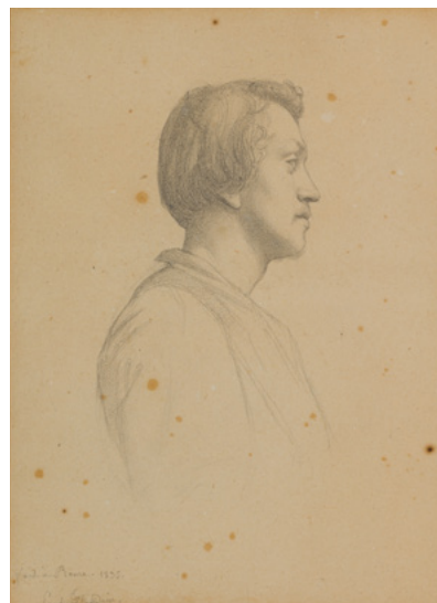
Paul Flandrin, Portrait d'Hippolyte, 1835, crayon graphite sur papier Collection particulière

1842 Décès brutal, à l'âge de trente-huit ans.