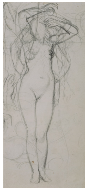
Jean Auguste Dominique Ingres, Étude pour La Source , vers 1820, crayon graphite sur papier

Paris, Beaux-Arts de Paris