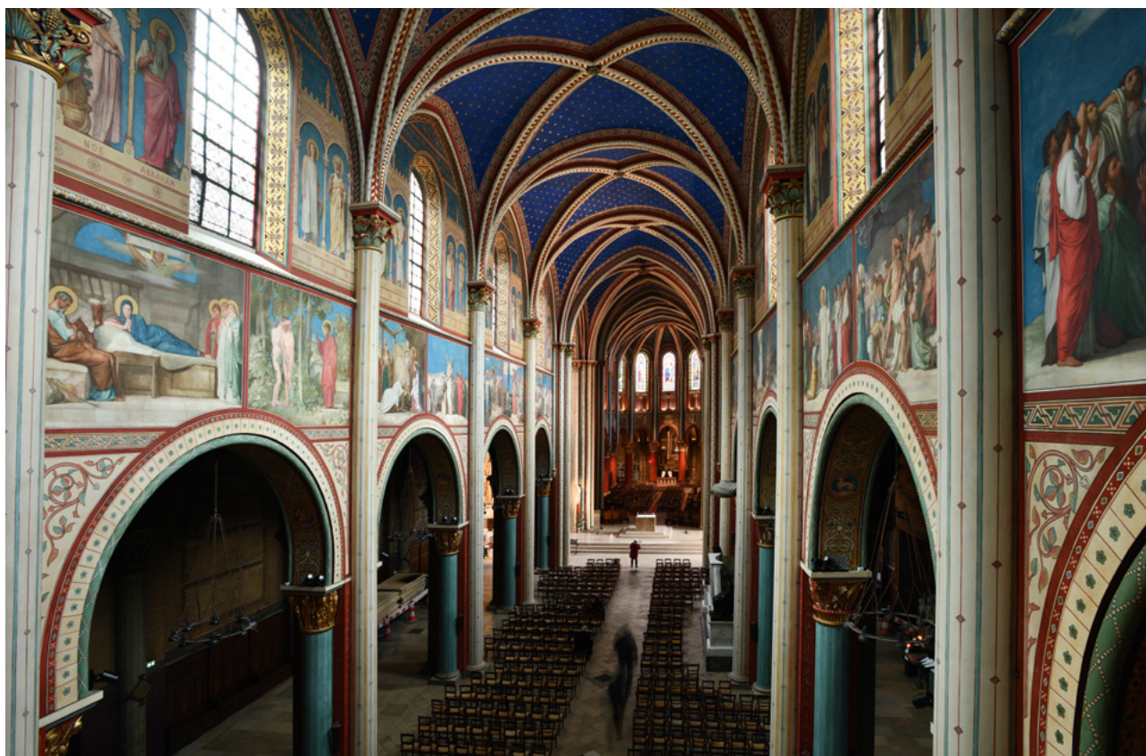
Vue intérieure de l'église Saint-Germain-des-Prés.

Ces décors ont fait l'objet d'un important chantier de restauration, conduit entre 2016 et 2020 par la Ville de Paris. Cette opération a bénéficié de la participation décisive du mécénat du Fonds de dotation pour le rayonnement de l'église Saint-Germain-des-Prés.