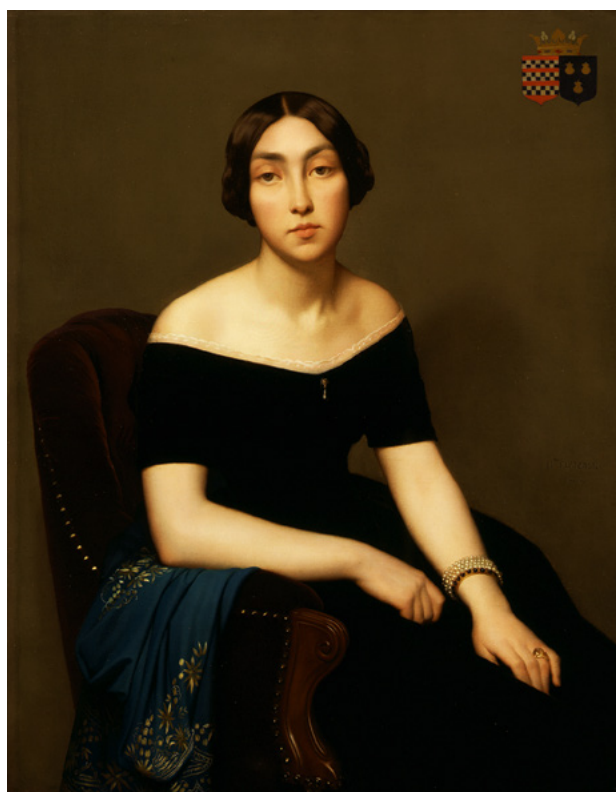
Auguste Flandrin Alexis Champagne , 1842, huile sur toile

Lyon, musée des Beaux-Arts