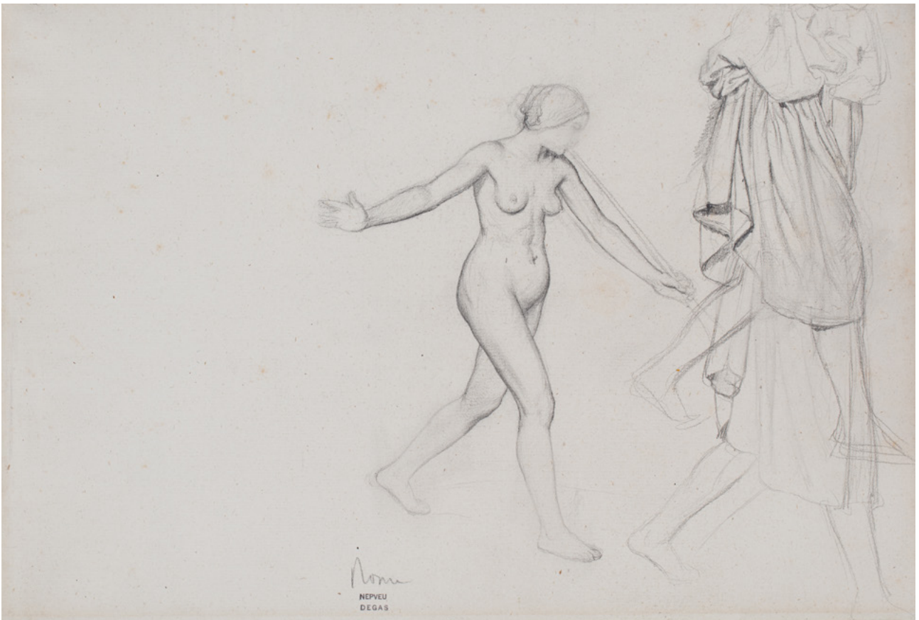
Edgar Degas, Étude de jeune femme nue jouant de la trompe et deux études du corps drapé, pour Saint Jean-Baptiste et l'ange, 1857, crayon graphite et estompe sur papier

lier qu'il dirige, pour ainsi dire, par procuration. Jules Élie Delaunay, Henri Regnault et Edgar Degas y étudient. Degas en retiendra une leçon fondamentale pour sa formation classique. Pierre Puvis de Chavannes et Maurice Denis, même s'ils ne sont pas des élèves directs d'Hippolyte, partagent son aspiration à la monumentalité et la référence à la peinture murale des Primitifs italiens. Hippolyte et Paul ont montré un intérêt précoce et expérimental pour la technique photographique, inventée en 1839. L'épilogue de l'exposition privilégie ce médium pour réunir des œuvres qui, au fil du 20 e siècle et jusqu'à aujourd'hui, font écho au travail des Flandrin, dans les domaines où ils se sont exprimés avec le plus d'originalité : le corps nu en plein air, le paysage et le double portrait.